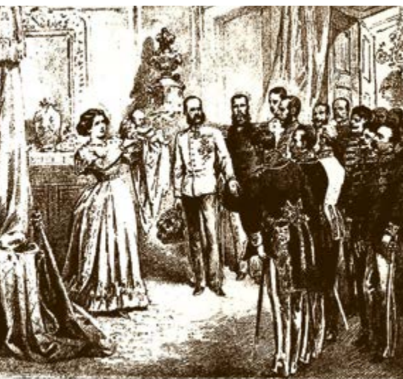
Der am 21. August 1858 in Laxenburg geborene Kronprinz Rudolf wird stolz dem ganzen Hofstaat präsentiert. Das interessante Blatt, 2. Februar 1889.