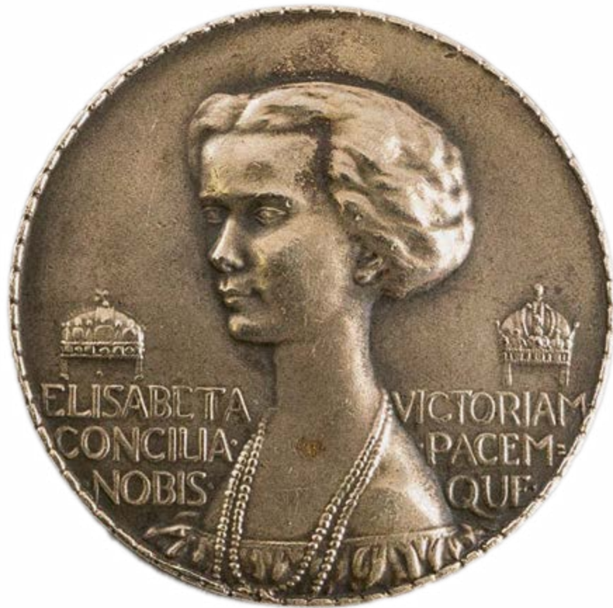
Kaiserin-Elisabeth-Friedenswunschmedaille, 1915. Mit Brustbild von Kaiserin Elisabeth zwischen ungarischer und österreichischer Krone, darunter ELISABETA VICTORIAM/CONCILIA PACEM/NOBIS QUEM (Avers) und Friedenstaube, darunter 1915 (Revers). Meisterpunze BSW.