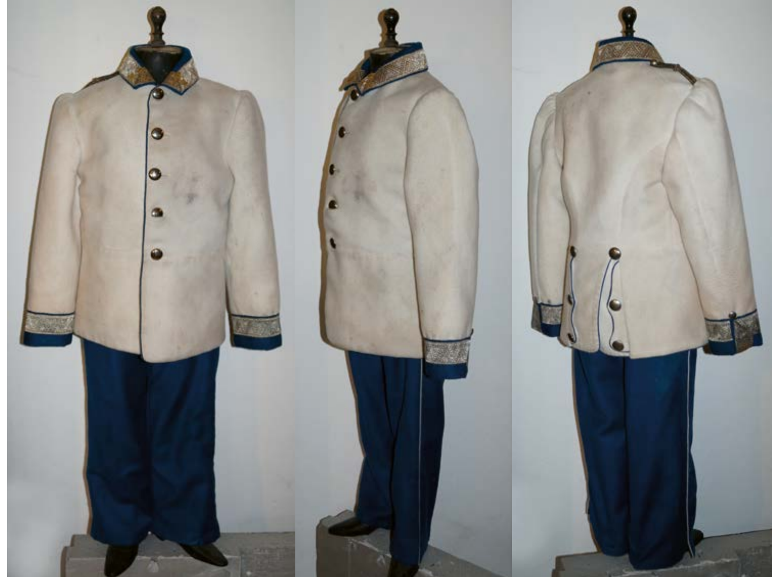
Kinderuniform eines Obersts des k. k. Infanterieregiments Nr. 17 nach der Adjustierung 1861 mit dem charakteristischen Umlegekragen und drei Sternen auf silbernen Borten, wie von Kronprinz Rudolf, beispielsweise auf dem Foto unten, getragen.