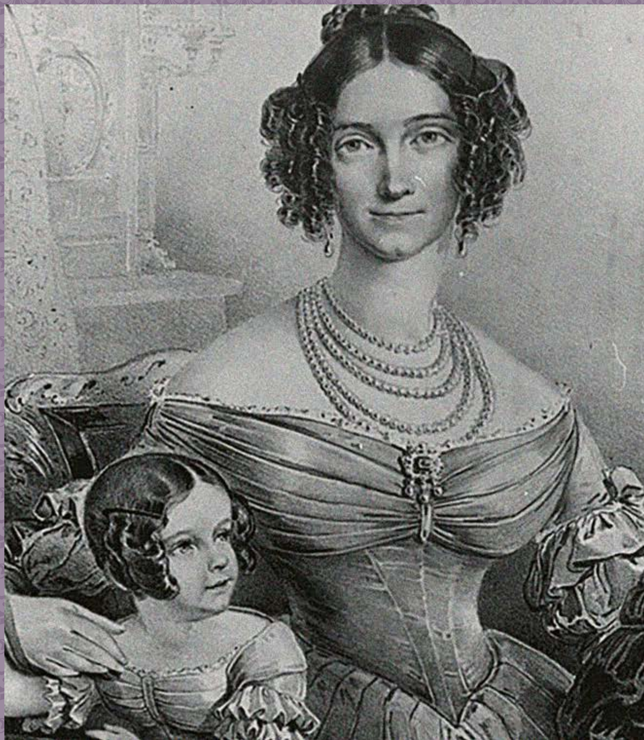
»Herzogin Ludovika in Bayern« mit ihrer ältesten Tochter Helene, genannt Néné (1834–1890). Lithografie um 1838 (Ausschnitt). Der Plan, sie mit Kaiser Franz Joseph zu verkuppeln, schlägt im letzten Moment fehl.