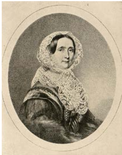
Mit der Geburt des so dringend erwarteten Thronfolgers scheint auch Sophies Sorge um den Erhalt der Dynastie ausgeräumt. Altersporträt von Erzherzogin Sophie – Lithografie.