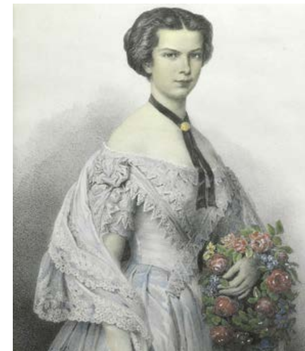
»ELISABETH Herzogin in Bayern«. Kolorierte Lithografie von Franz Hanfstaengl aus ihrem Verlobungsjahr 1853.

sich – trotz Bedenken. Die überaus scheue Sisi fühlt sich hingegen völlig überrumpelt. Sie reagiert gänzlich verlegen und ist bald überfordert von der plötzlichen Aufmerksamkeit in der Öffentlichkeit. Aber sie weiß auch: Einem Kaiser gibt man keinen Korb. Und so wird in Ischl am 19. August die Verlobung des künftigen Kaiserpaars festlich begangen. Mit einem Schlag weicht aus Sisi die jugendliche Unbeschwertheit. Die künftige Schwiegermutter möchte die als Naturkind in Possenhofen aufgewachsene Sisi nun im Eilverfahren formen, disziplinieren und so zur überragenden Hocharistokratin machen. Die Konflikte sind damit genauso vorprogrammiert wie die Revolten und das Scheitern.