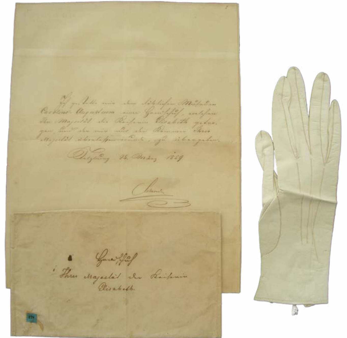
Persönlicher Handschuh Kaiserin Elisabeths mit handschriftlicher Authentik und Datierung vom 28. März 1859 in Salzburg.