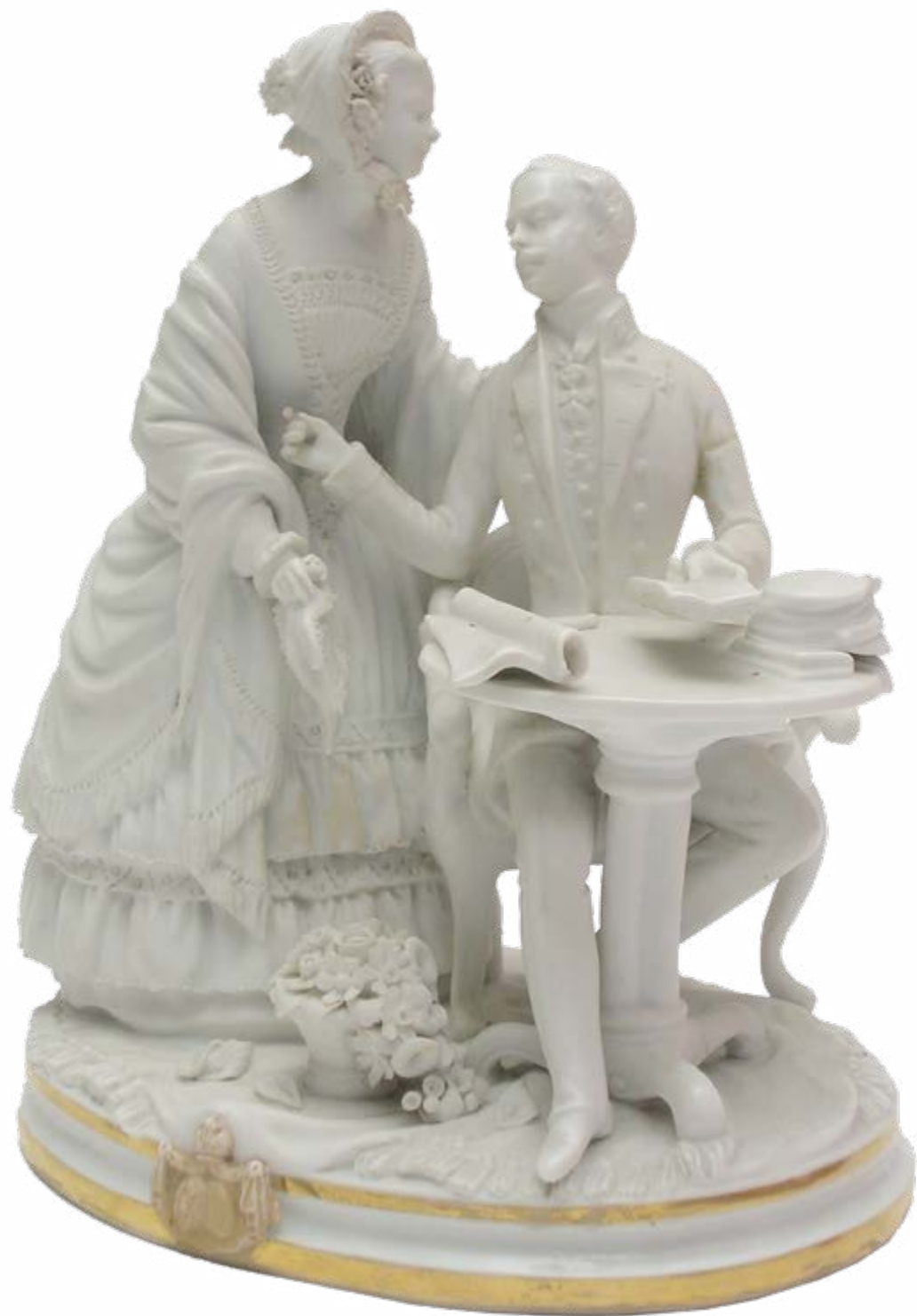
Kaiser Franz Joseph am Tisch sitzend mit Kaiserin Elisabeth in bürgerlicher Tracht. Biskuitporzellan-Statuette aus der Wiener Porzellanmanufaktur.