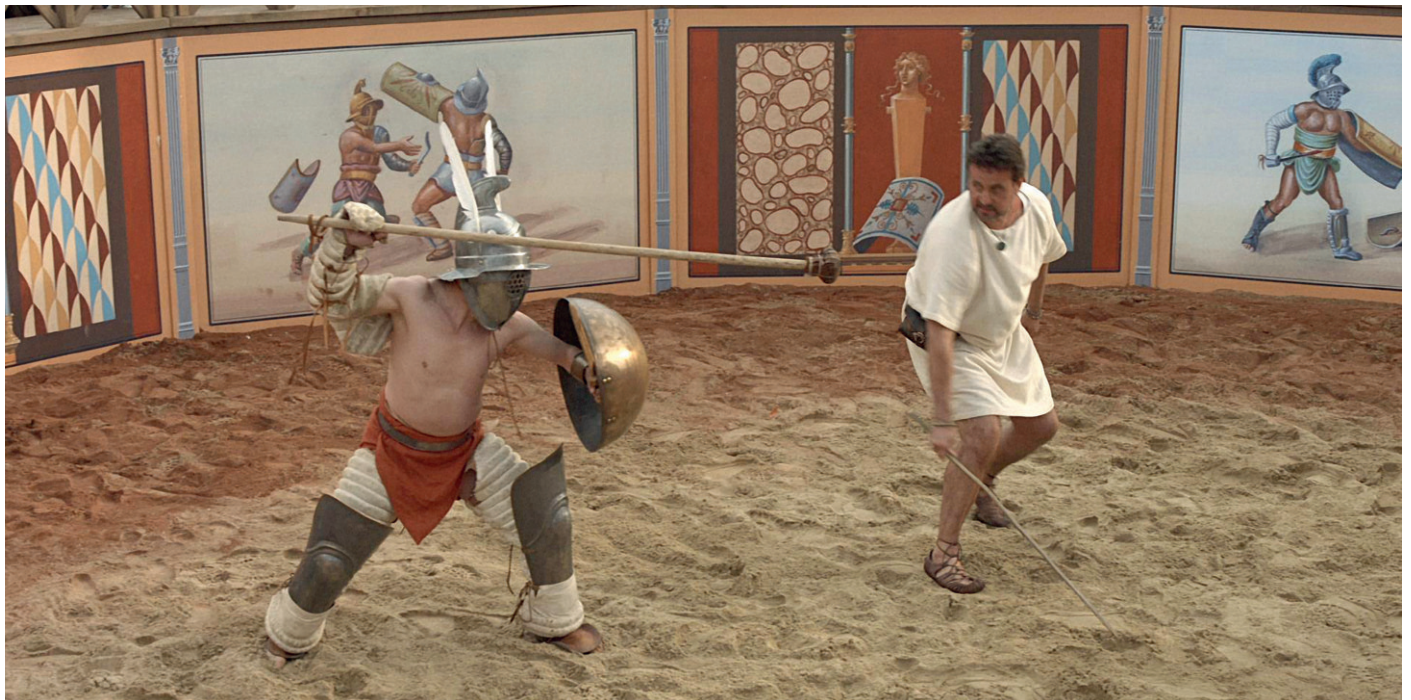
Hoplomachus in Grundstellung