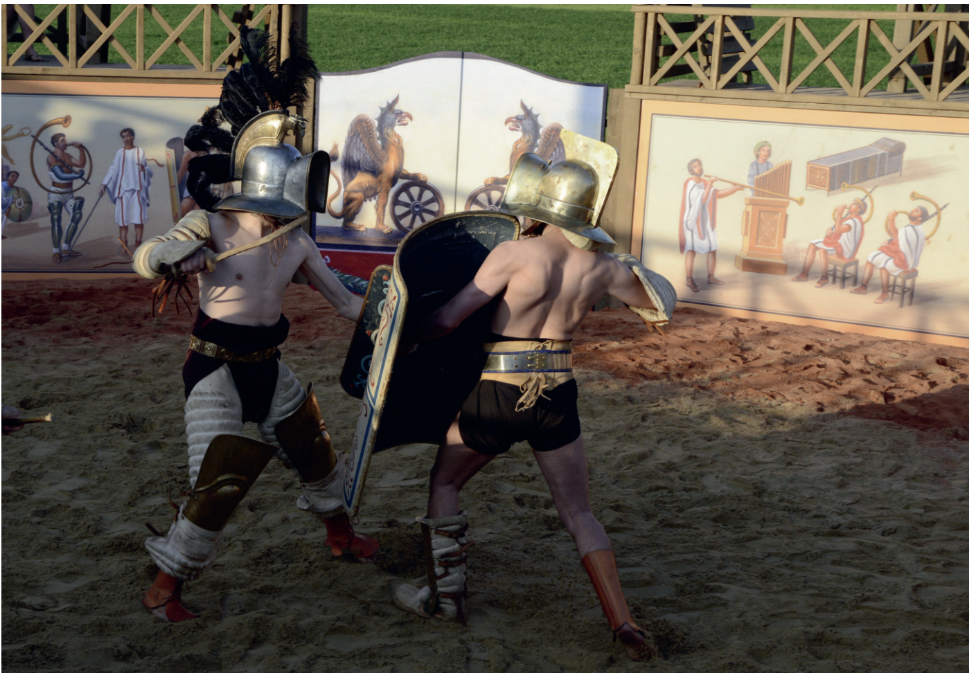
Murmillio gegen Thraex.