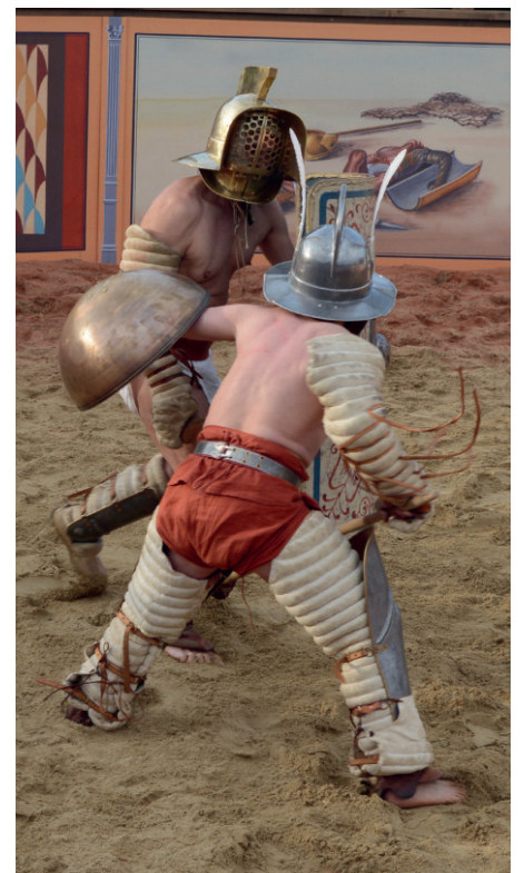
Murmillo gegen Hoplomachus

händer - das linke Bein panzerte, hing mit der Grundstellung des Gladiators mit vorgenommener, in die Wölbung des Schildes geschmiegener linker Schulter und vorgesetztem linken Fuß zusammen. Der Fechtstil wurde vor allem vom Schild geprägt, der nicht nur defensiv, sondern auch offensiv zum Rammen und Behindern des Gegners eingesetzt wurde, was allerdings in Anbetracht eines Gewichtes von ca. 7 kg sehr anstrengend war. Das in Filmen so beliebte Klinge-an-Klinge-Fechten à la 3 Musketiere war in der Anti-