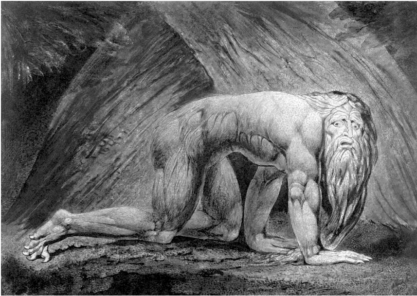
Die Seelenqualen eines einstmals mächtigen Herrschers. William Blake, Nebukadnezar (ca. 1795–1805).

ihnen nicht, eine Lösung zu präsentieren, und als Folge verlieren sie ihre Macht und potenziell sogar ihr Leben. In eben diese angespannte Konstellation tritt jemand, der nicht die geringste Macht besitzt: ein rechtloser junger Fremder, ein Kriegsgefangener, eine Geisel aus einer geplünderten Stadt. Es ist nicht definitiv geklärt, ob Gott wirklich Daniel den Traum des Königs offenbarte oder ob der junge Mann womöglich einfach die nötige menschliche Einsicht besaß, um das wahre Wesen der Not des Königs zu erkennen. Das Buch enthält weiter hinten zwar Verse, in denen Gott dafür gedankt wird, dass er Daniel zur Seite stand. Doch das ist eine Interpolation. Die Geschichte selbst legt eine ganz andere Schlussfolgerung nahe, nämlich dass der junge Mann die Lage zu deuten wusste, in der sich der König befand. Was konnte ein so mächtiger Mann wie Nebukadnezar schon fürchten außer der eigenen Sterblichkeit? Und wie könnte man ihn besser mit dieser furchtbaren Gewissheit versöhnen, als indem man seine ewige Vorherrschaft über den Rest des menschl-